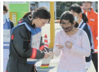
トリアージエリア