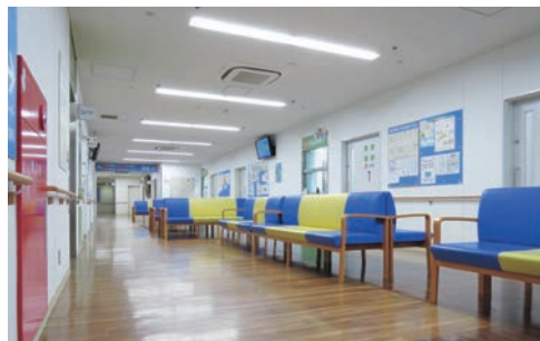
明るくなった待合

中央外来棟2階には眼科と耳鼻科があり非常に混みあいますが、病院増改築工事において改装がなされていなかったため、待合は暗く患者さんにご迷惑をかけておりました。しかし少しでも綺麗にし快適に過ごせるよう7月から9月にかけて、1階と同じ木目調の床材を貼り、天井・壁も塗装をなおすことで明るくなりました。また、蛍光灯をLEDに、エアコンを省エネタイプのものに更新することで環境にやさしい待合改善となりました。