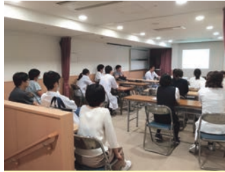
チームミーティング

患者さんに対して多職種で連携をとりながら、外来と入院を通じてより満足度の高い診療を提供できるよう、定期的に勉強会や研修を行いながら診療の質の向上を目指しています。