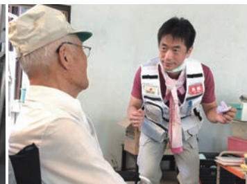
平成30年7月豪雨災害