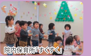
院内保育所「すくすく」

院内保育所「すくすく」と病児保育所「すこやか」があります。午前800～午後600まで保育します。