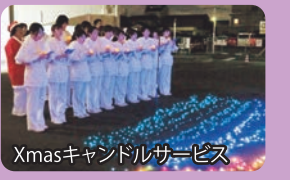
Xmasキャンドルサービス