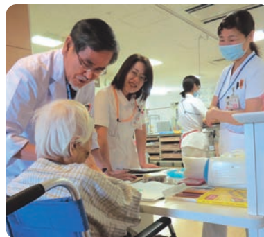
DST(認知症サポートチーム)の定期ラウンド